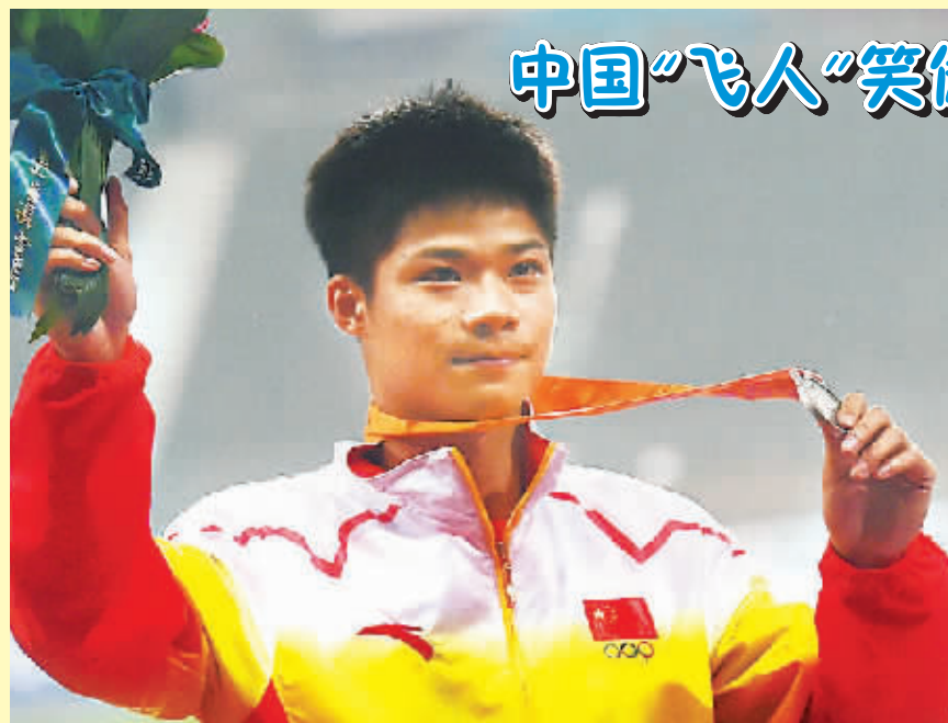
9月28日,在仁川亚运会田径男子100米决赛中,中国选手苏炳添以10秒10获得亚军。图为苏炳添在领奖台上。