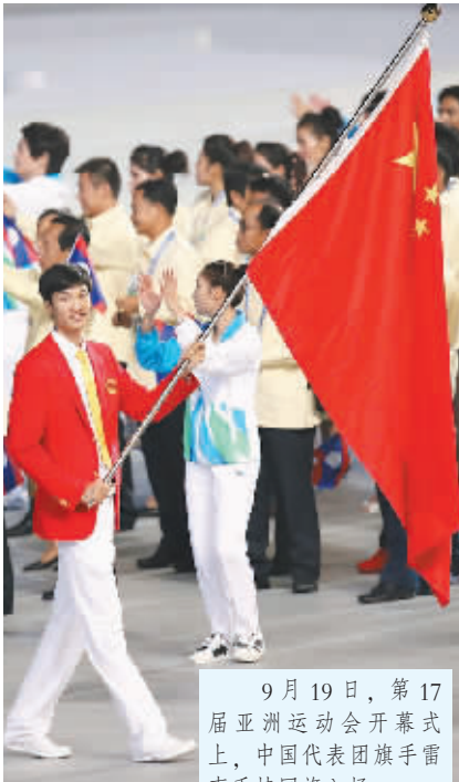
9月19日,第17届亚洲运动会开幕式上,中国代表团旗手雷声手持国旗入场。