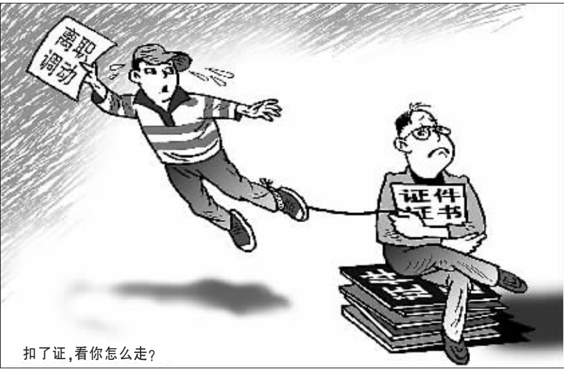
扣了证,看你怎么走?