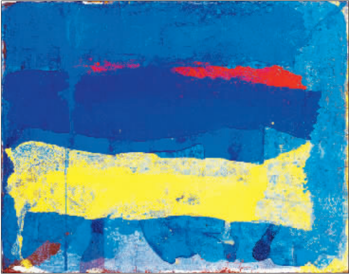
绘画研习 (丙烯 矿物颜料 手工纸)

2014 油画双年展选择以“在场”为主题，展现中国油画创作沿革的脉络和本土特性，强调从历史之场、生活之场、突围之场三个方面，深刻揭示中国当代画家的思考与突围。(源源)