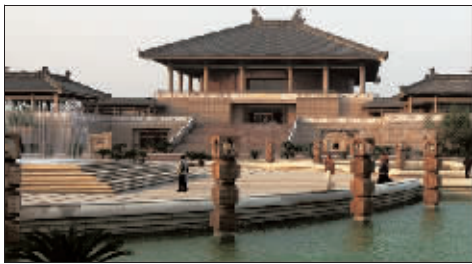
孔子研究院 (建筑设计作品)

8月29日，中国美术馆与清华大学联合主办的《人居艺境——吴良镛绘画书法建筑艺术展》在中国美术馆开幕，展出作品囊括了吴良镛先生各个阶段的书法、绘画作品100余幅，以及菊儿胡同新四合院、孔子研究院等六项建筑设计工程，全面反映了吴良镛先生在学术探索的过程中对艺术创作的不懈追求。(法明)