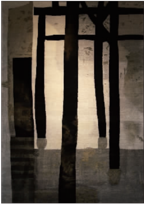
白墙村托的立木 (真丝手工壁毯)