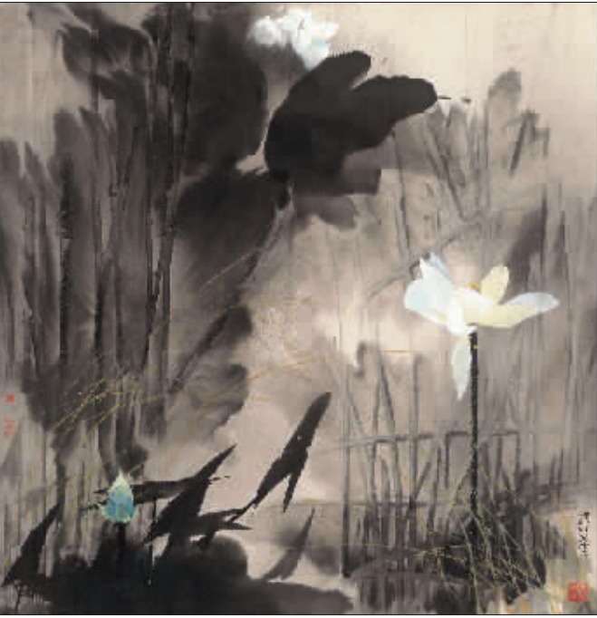
幽 香 (彩墨)