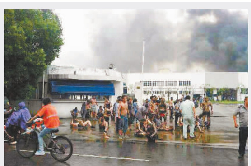
2014年8月2日,江苏省苏州市,昆山工厂发生惨烈爆炸,多人受伤,在等待救助。