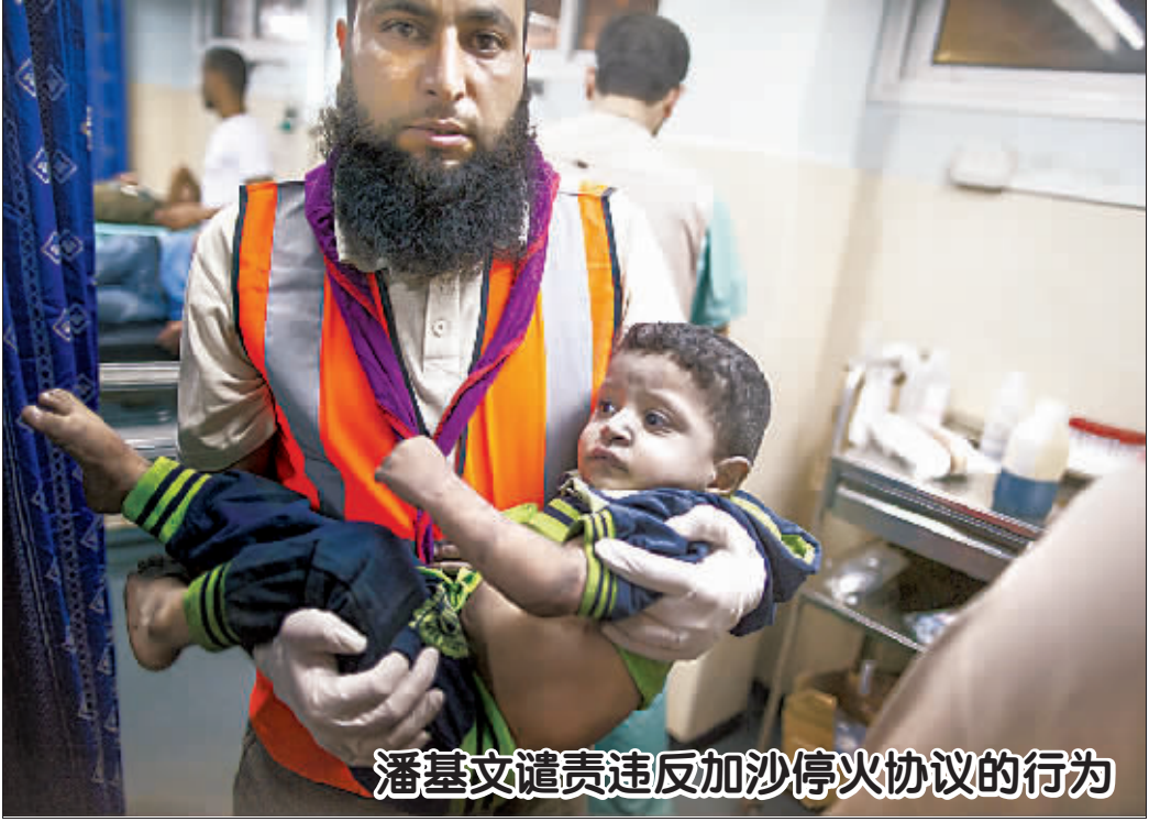
潘基文谴责违反加沙停火协议的行为

根据世卫组织 19 日发布的埃博拉疫情最新通报,截至 16 日,几内亚、利比里亚、尼日利亚和塞拉利昂累计出现埃博拉病毒确诊、疑似和可能感染病例 2240 例,死亡 1229 人。