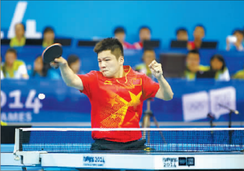
樊振东在比赛中。