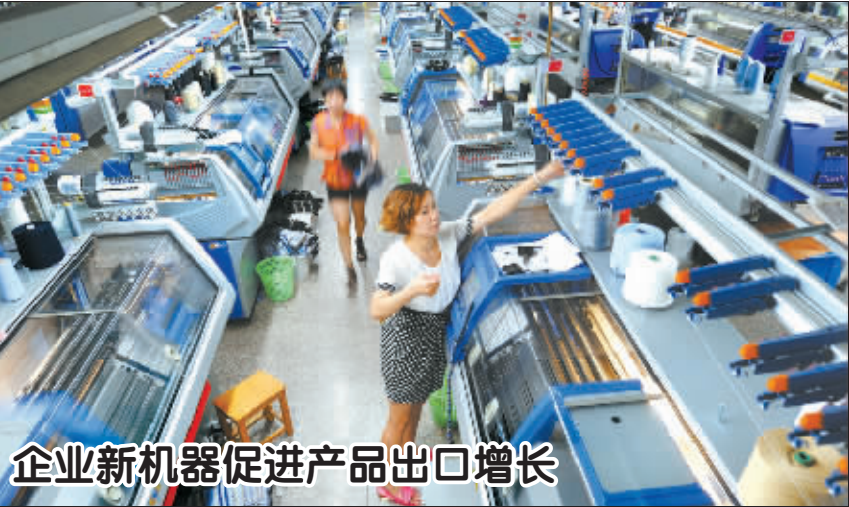
企业新机器促进产品出口增长

8月12日,杭州桐庐富春江织造集团公司织机车间里,员工在德国进口的全自动电脑织机前操作。