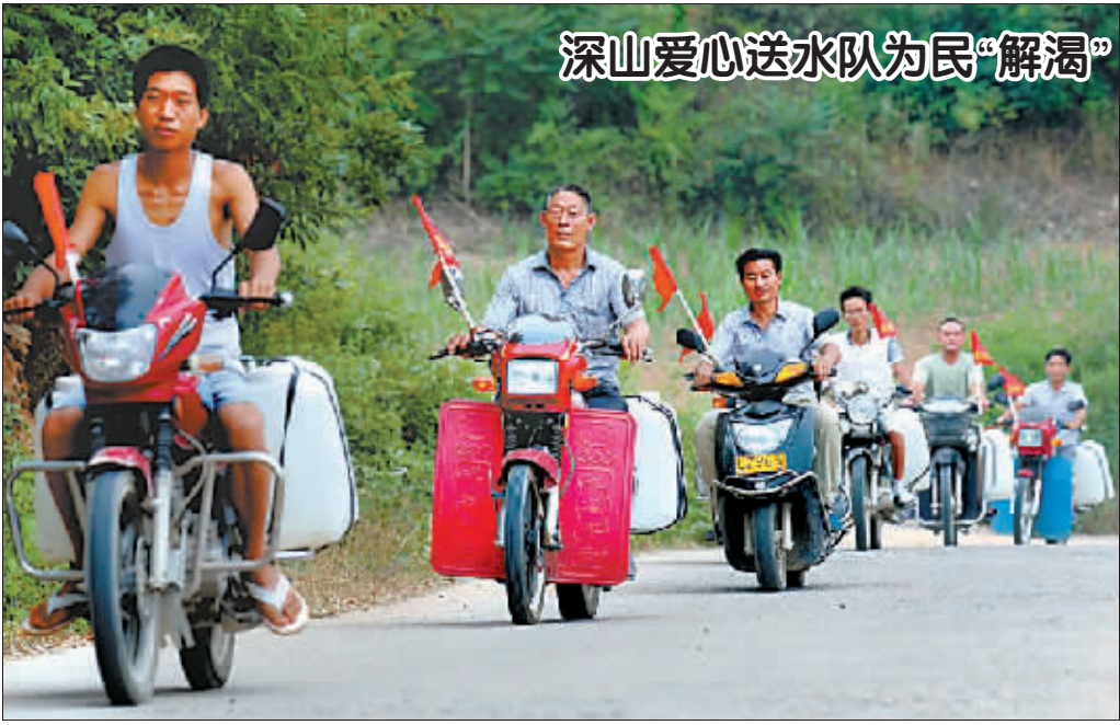
深山爱心送水队为民“解渴”

有移动互联网人士指出,微信公众号阅读量、点赞量公开将有助于压缩大V微信号的水分,避免用户等被宣传或嘘头遮蔽眼睛,不过,该功能刚一推出,不少淘宝卖家就瞄准了商机,公开叫卖公众号阅读量,“15元就能刷1000个图文阅读量”。