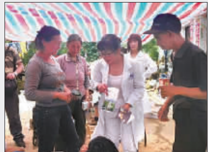
医护人员在向村民发放药品。