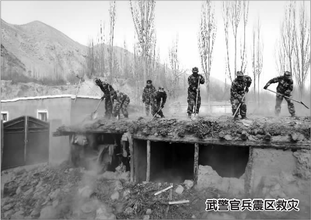
2月13日，武警官兵在于田地震灾区为受灾群众拆除危房。当日，武警新疆总队第五支队260名救援官兵奉命连夜赶赴于田地震灾区实施救援，为受灾村民清理、拆除受损危房，搭建临时安置帐篷，看望和慰问受灾群众，协助恢复震后生活秩序。

10年来，公务员工资一直未动，而每一次有关给公务员涨工资的呼吁，几乎都会引来社会舆论一片质疑之声，而长时间不涨工资，又在公务员队伍中激起抱怨连连。对此，中国社会科学院人口与劳动经济研究所研究员、人力资源研究室主任高文书分析，在收入分配差距较大的背景下，舆论担心会进一步扩大收入差距；同时，很多人都认为公务员已是高收入群体，不仅工资高，还有一定灰色收入，不应给他们提高工资。“灰色收入也不是每个公务员都有，只有那些真正掌握实权的领导才有可能有，我们这种小公务员，哪来的灰色收入？”陕西某市税务部门的一位王姓公务员说，“再怎么整风，过年的时候，该送的礼照样得送到领导手里，只是更隐蔽了而已。” 把腐败官员与普通公务员混淆，这是来自公众认识的误伤。然而，实实在在的公务员隐性福利，恰是造成这一误伤的关键所在。由于