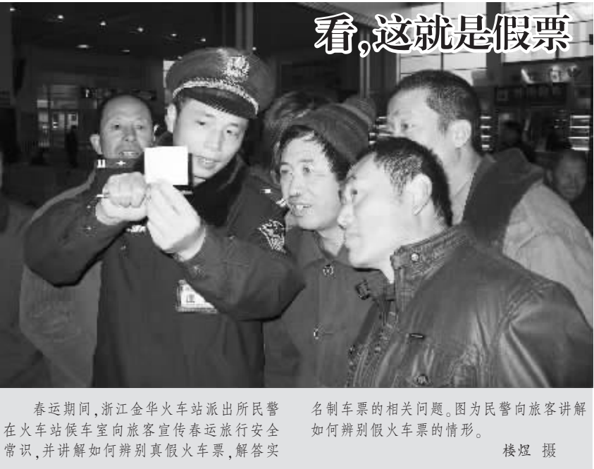
春运期间,浙江金华火车站派出所民警在火车站候车室向旅客宣传春运旅行安全常识,并讲解如何辨别真假火车票,解答实名制车票的相关问题。图为民警向旅客讲解如何辨别假火车票的情形。

据调查,南阳市宛城区交通局对该路段负有日常维护、清洁等管理职责。死者赵宁与青年女子蒋英英2011年3月未办结婚手续情况下,按农村风俗结婚同居生活,赵宁因该交通事故淹死时,蒋英英已怀孕七个月,并于2012年5月2日生下一女孩,取名赵悦筠。