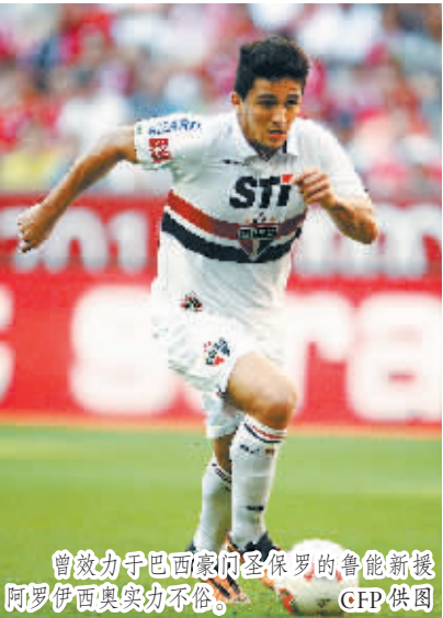
曾效力于巴西豪门圣保罗的鲁能新援阿罗伊西奥实力不俗。

多个赛季以来在外援引进上吃亏不少的鲁能,在新赛季的外援配置上更是不惜重金。除留下巴西名将洛维和澳大利亚国脚麦克格文外,鲁能与上赛季的其余3名外援悉数解约,转而将引援目光投向名气更大、实力更强的大牌。最终,鲁能花费500万美元引进巴西国脚阿罗伊西奥,随后又掏出750万美元引进阿根廷国脚蒙蒂略,组成了新赛季的“国脚外援四人组”。