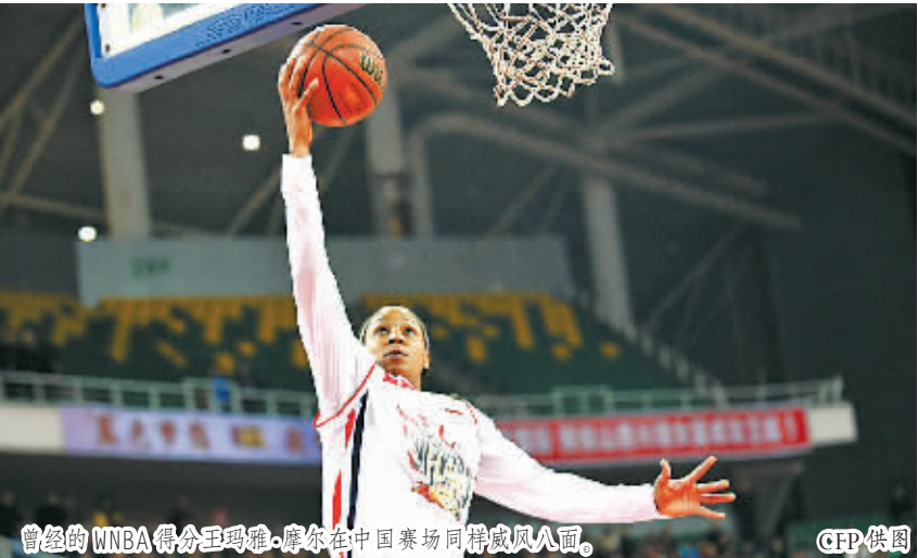
曾经的WNBA得分王玛雅·摩尔在中国赛场同样威风八面。