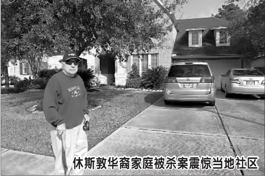
休斯敦华裔家庭被杀案震惊当地社区