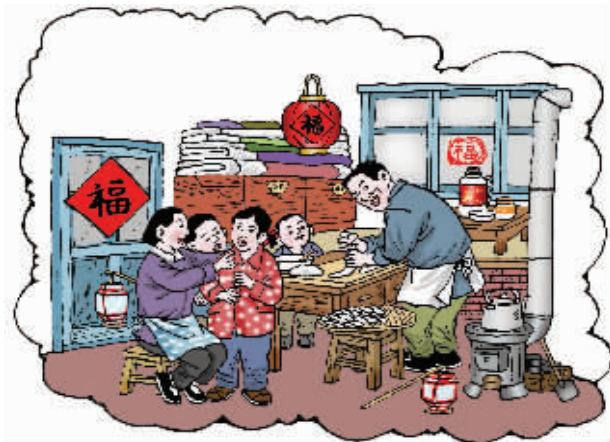
七八十年代想过年