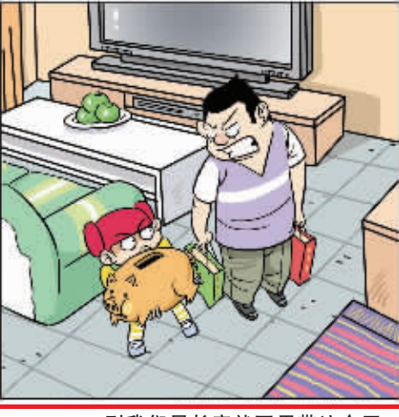
到我们局长家就不用带这个了