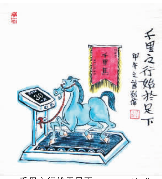
千里之行始于足下