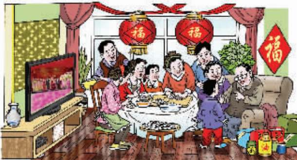
如今过的是幸福安康年