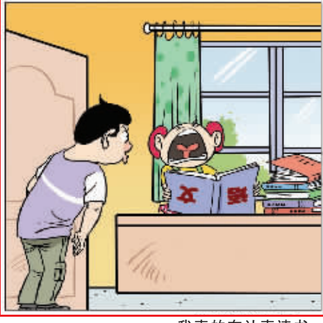
我真的在认真读书