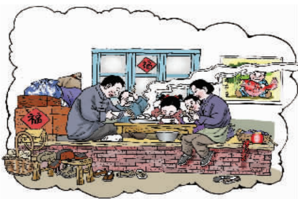
五六十时代盼过年