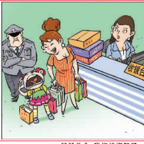
爸爸救命, 我们被绑架了!