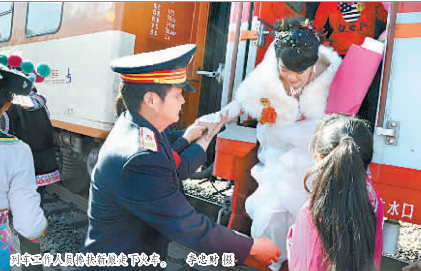
列车工作人员 escort 新娘下车。