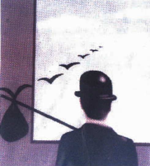
城市规模无限地扩大,植被面积日渐缩小。人们迁徙过后,回忆曾经美好的故乡,泪水涌心头。