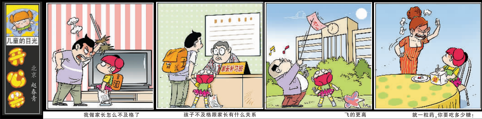
我家长辈怎么不及格了