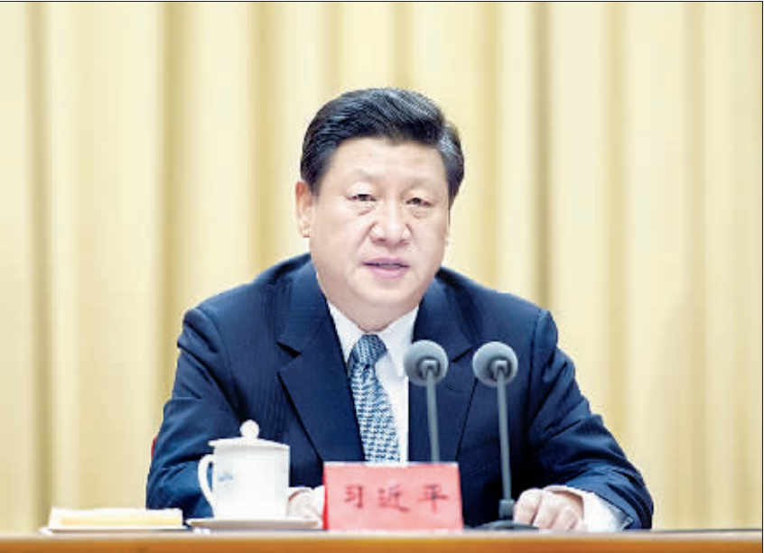
1月20日,中共中央总书记、国家主席、中央军委主席习近平在党的群众路线教育实践活动第一批总结暨第二批部署会议上发表重要讲话。新华社记者 谢环驰 摄

新华社北京1月20日电 党的群众路线教育实践活动第一批总结暨第二批部署会议1月20日在北京召开,中共中央总书记、国家主席、中央军委主席习近平出席会议并发表重要讲话,对第一批教育实践活动进行总结,对第二批教育实践活动进行部署,他强调,要充分运用第一批活动经验,紧紧扭住反对“四风”,从群众最关心、最迫切的问题入手,着力解决关系群众切身利益的问题,解决群众身边的不正之风问题,把改进作风成效落实到基层,真正让群众受益,努力取得人民群众满意的实效。 中共中央政治局常委李克强、张德江、俞正声、王岐山、张高丽出席会议,中央党的群众路线教育实践活动领导小组组长刘云山主持会议。会议以电视电话会议形式举行,开到县一级和中国人民解放军、武警部队团级以上单位。 习近平在讲话中指出,第一批教育实践活动取得了重要阶段性成果,促使党员、干部得到了党性锻炼,刹住了“四风”蔓延势头,带动了社会风气整体好转,贯彻群众路线的长效机制和刚性约束初步形成。教育实践活动带来的新变化新气象,群众充分认同,党内外