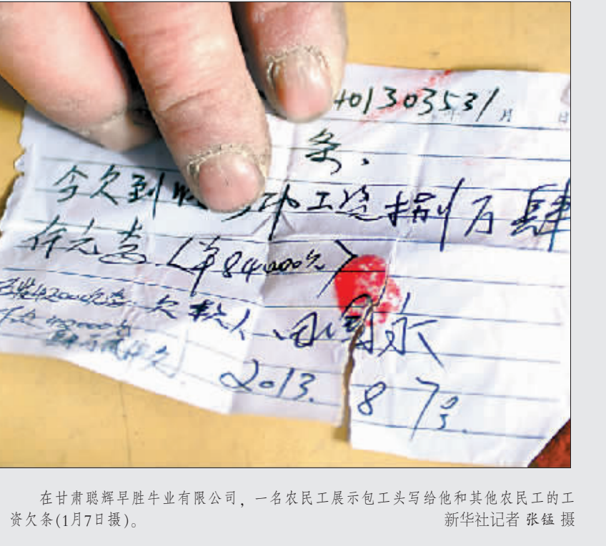
在甘肃聪辉早胜牛业有限公司,一名农民工展示包工头写给他和其他农民工的工资欠条(1月7日摄)。

还拿不到钱,其他人还要回来。 “干了4个月活,讨了4个月的薪,这一年算是完了。”詹怀庆是甘肃省民乐县南古镇人,他告诉记者,家里的土地已全部流转,全家人指望他打工挣钱过年,可现在连家也不敢回。 记者了解到,这些农民工是被一个戈壁养牛“神话”项目吸引来的。2012年5月,永昌县政府招商引进甘肃聪辉早胜牛业有限公司,号称要在西大滩建设一个“占地5万亩,总投资60亿元,年产60万头肉牛”的现代养殖基地。当时,项目举行了盛大的开工奠基,领导出席、嘉宾助兴、媒体捧场。 项目开工引来大批建设企业和农民工。据了解,2013年3月前后,在西大滩牛场建设工地,共有10户企业从甘肃聪辉早胜牛业有限公司承包了牛棚建设,干活的农民工来自甘肃、四川、重庆等10余省市,最多时有1000多人。 “干活的农民工,大多数没有拿到工资,人数过千,欠薪上千万。”甘肃聪辉早胜牛业有限公司第二项目部负责人张宏杰说,这一数字记者从永昌县劳动保障监察大队也得到了证实,根据10家工程承包企业提供的工人出勤和欠薪登记册,干活农民工有1200余人,总工资在800万至1000万元。 (下转第3版)