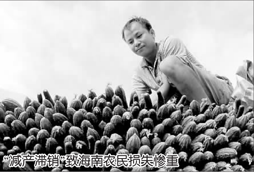
“减产滞销”致海南农民损失惨重

截至目前,全市各镇、办事处及规模企业帮扶工作站累计筹集帮扶资金1210余万元,帮扶困难职工(农民工)9000多人次。其中,生活救助2659人次,医疗救助1200人次,资助困难学生670人次,提供信访接待和法律援助460人次,为农民工追讨欠薪60余万元。