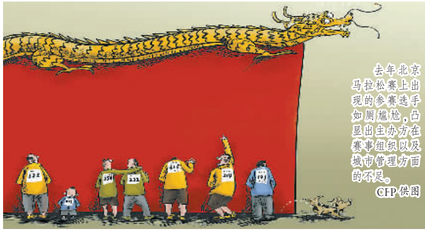
去年北京马拉松赛上出现的参赛选手如厕尴尬,凸显出主办方在赛事组织以及城市管理方面的不足。

可以预见,国内的“马拉松热”还会持续较长一段时间。只有进一步普及和推广马拉松运动内涵,吸引更多普通民众的参与,马拉松赛事才能具备长久的生命力。