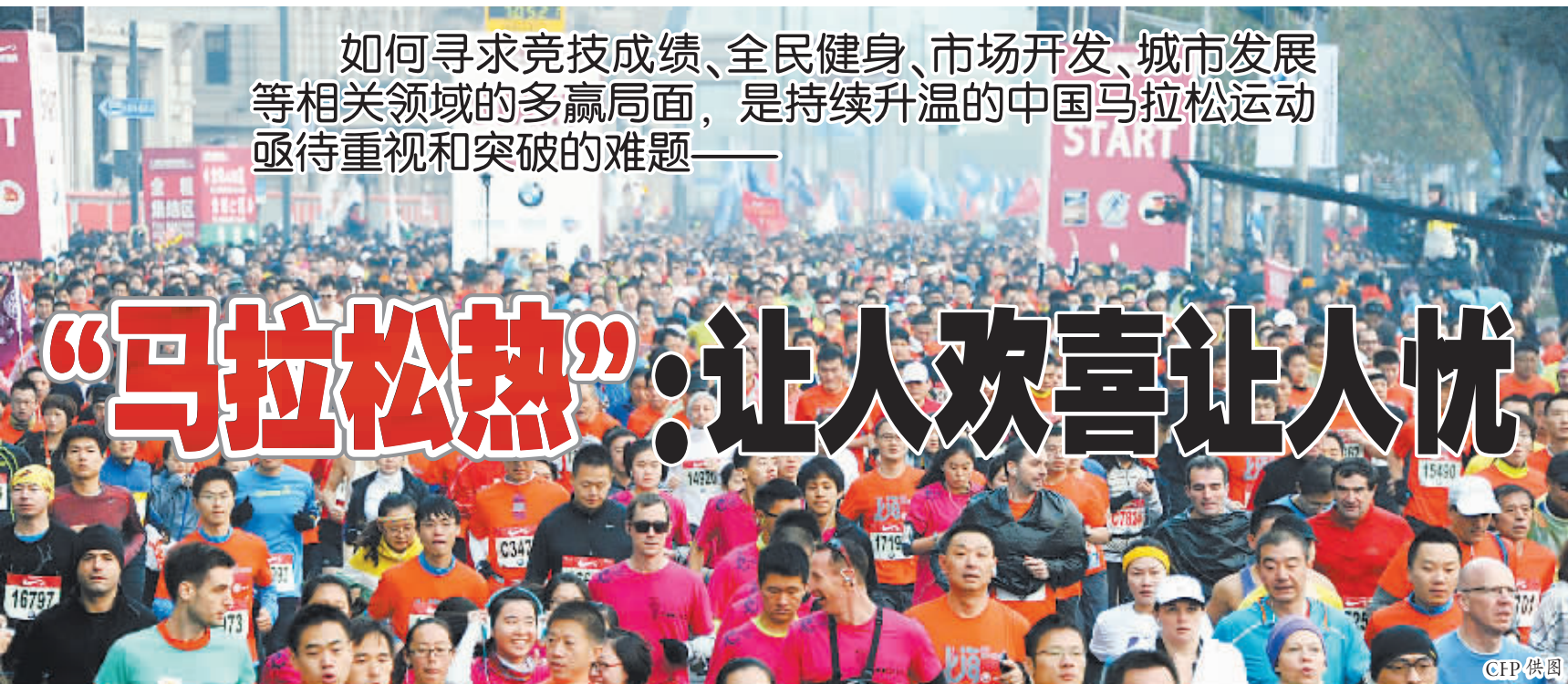
如何寻求竞技成绩、全民健身、市场开发、城市发展等相关领域的多赢局面,是持续升温的中国马拉松运动亟待重视和突破的难题——