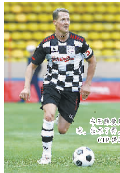
车王酷爱足球,技术了得。

在本次舒马赫发生滑雪事故后,英国F1记者加塞德表示,“舒马赫身体中有着特殊的基因。一般人对于参与高速运动有一种恐惧,但舒马赫没有,他只有不断挑战时间的基因。他开F1赛车是这样,滑雪也是这样。”看来,作为F1历史上的传奇人物,在赛车场上“超越”了一项又一项纪录的舒马赫,在退役之后,仍然希望找到一个运动项目来延续他人生中的“速度与激情”。