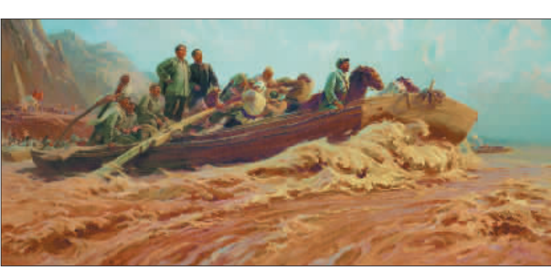
东渡黄河 (中国国家博物馆藏) 钟涵

11 月 24 日,由中国美术馆、中国美术家协会、中央美术学院、中国油画学会共同主办的“厚土人文——钟涵艺术展”在中国美术馆举办。展览展出不同时期作品近 300 件,钟涵全面反映 60 年来在探索“中国油画精神”的道路上,作出的关于视觉美学的深度思考与创新实践。