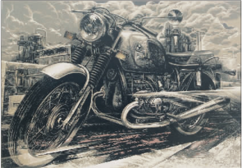
迷途 (木版) 崔柏涛

西部曾是中华民族文明的发祥地,也是东西方文化交会之地。新中国成立后,西部建设受到党和国家的高度重视,西部主题美术也进入新时代,美术家有组织或自发走向西部进行民族美术的探索创作成为 20 世纪中国美术的重要现象。“走向西部——中国美术馆馆藏精品展”共展出中国美术馆馆藏西部主题作品 150 余件,跨越国画、油画、版画、雕塑、连环画等艺术门类,展示了西部美术在 20 世纪中国艺术史中的重要意义和价值。中国美术馆馆长范迪安说道:“走向西部”这个主题贯穿了 20 世纪中国美术的文化理想,西部的美术作品拥有极为鲜明的中国气派。