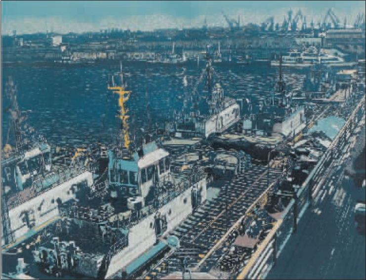
港湾系列 (绝版木刻) 陈豪