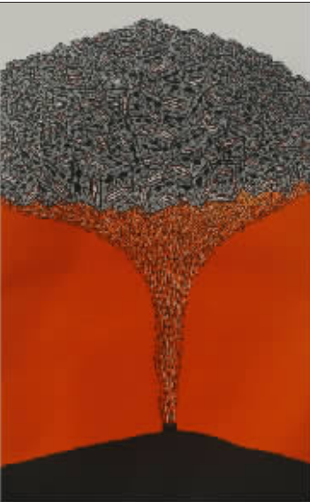
开始的启示之一 (木版油印) 李岱