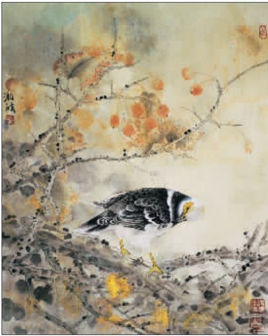
秋颜 (国画) 陈湘波