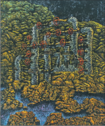
无声的风 (丝网版) 宋新忠