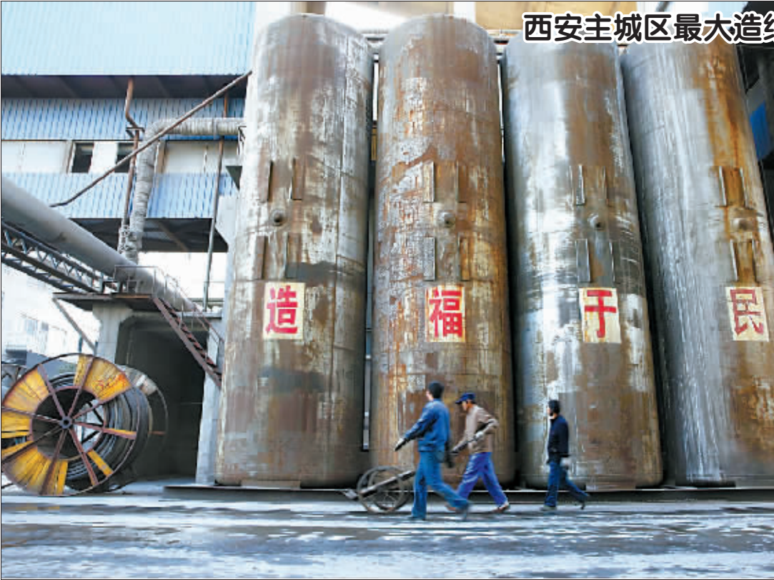
西安主城区最大造纸厂拆除

据悉,“中国休闲城市发展综合评价”活动由世界休闲组织、中国旅游协会、全国休闲标准化技术委员会、中国旅游协会休闲度假分会主办,依托国家旅游局课题“中国休闲城市发展综合评价体系”为理论依据,综合网络、公众、专家评定等方式,针对城市的休闲功能、休闲环境建设进行评价。