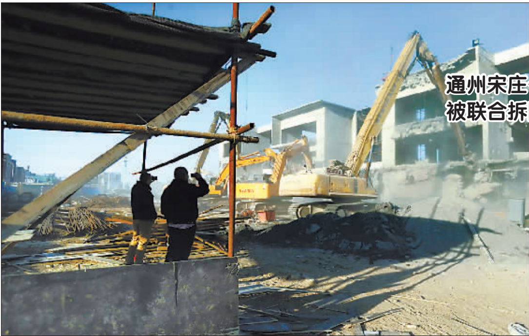
通州宋庄一大型建筑被联合拆除

中间投入价格指数连续回落。中间投入价格指数为54.8%,比上月回落1.3个百分点,已连续4个月回落,表明生产经营成本上涨势头有所减弱。