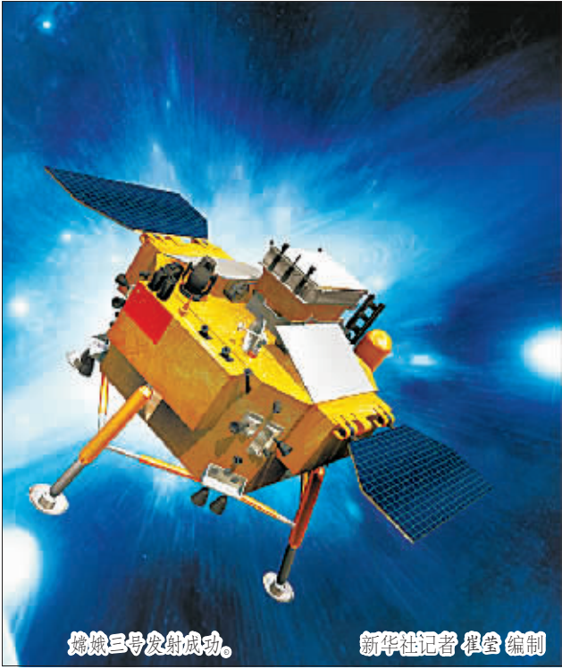
嫦娥三号发射成功。 上形成了一道明亮而美丽的光带。 为满足嫦娥三号入轨精度要求,中国目前推力最大的长征三号乙运载火箭进行了多项技术状态改进,提高了可靠性和安全性。这也是长征系列运载火箭的第186次飞行。 (下转第3版)