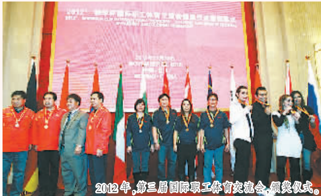
2012年,第三届国际职工体育交流会,颁奖仪式。