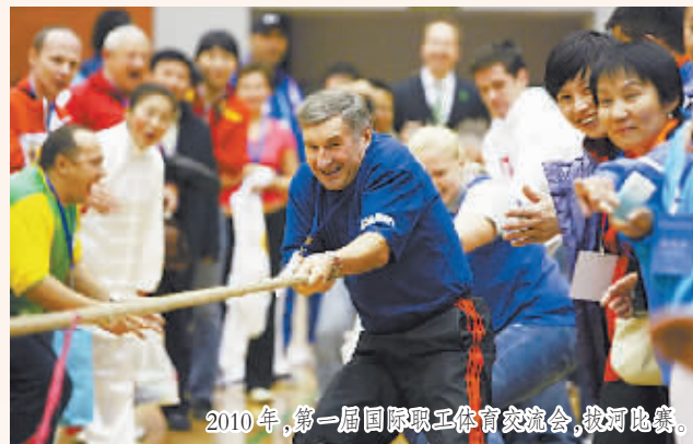
2010年,第一届国际职工体育交流会,拔河比赛。