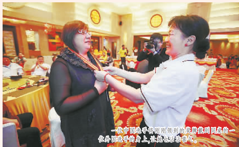
一位中国选手将刚刚领到的奖牌戴到同桌的一位外国选手的身上,让她也沾沾喜气。