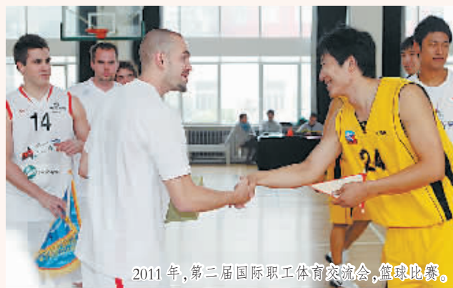
2011年,第二届国际职工体育交流会,篮球比赛。