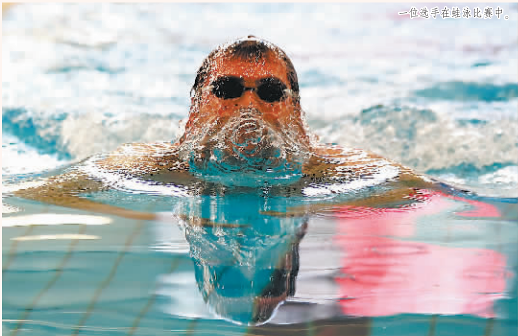
一位选手在蛙泳比赛中。