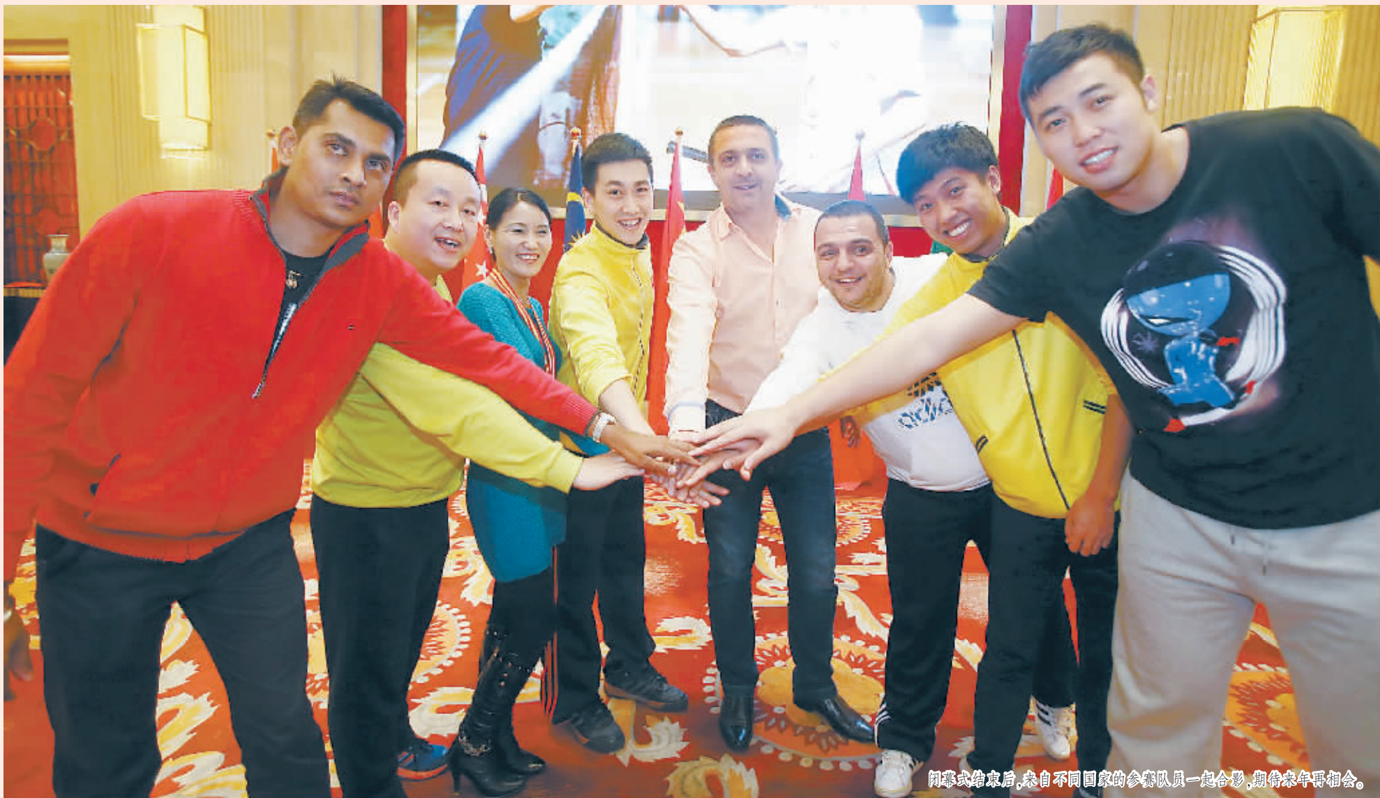
闭幕式结束后,来自不同国家的参赛队员一起合影,期待来年再相会。