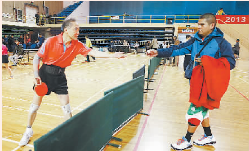
一位刚刚参加完篮球比赛的墨西哥队员在观看乒乓球比赛时,帮助球员捡起出界的乒乓球。