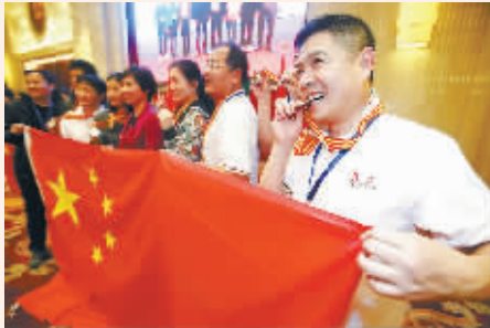
“尝尝”奖牌的含金量。

11月27日至28日,2013「国际职工体育交流会在北京举行,共有来自国内外工会和职工体育组织的120余名职工代表参加。国际职工体育交流会2010年在北京举行了第一届,此次是中国工会第四次举办该项活动。交流会期间,北京遭遇了入冬以来的首次寒流,但见面时的一个微笑、一句问候,比赛后的一声鼓励、一句祝贺,交流时的一个拥抱、一句祝福,无不让各国参赛运动员感受到浓浓暖意。本届交流会,中国工会响应中央号召,节俭办会,压缩了会期,减少了流程,但提高了比赛节奏,增加了各国队员们交流的机会。可以说是简约而不简单,朴实又不失隆重,精简精练更精彩。在比赛中,各国选手赛出了水平,赛出了风格,比赛场上是对手,比赛场下是朋友,大家在享受比赛带来的快乐的同时,也结下了深厚友谊。从2010年至今,国际职工体育交流会已经举办四届,通过比赛和交流,增进了各国职工和工会之间的友谊,丰富了职工国际交流的内容和形式,加强了各国职工和工会之间的团结,此项赛事已成为各国职工人文交流的重要平台。会期虽已结束,但职工人文交流的种子已在各国劳动者的心中扎根,大家期待来年再次相会。