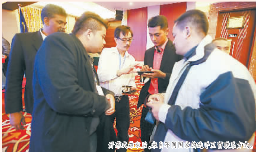
开幕式结束后,来自不同国家的选手互留联系方式。