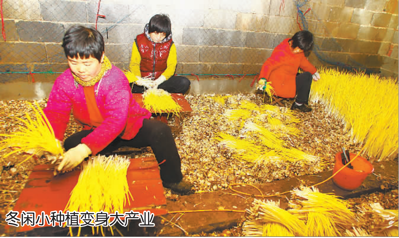
冬闲小种植变身大产业