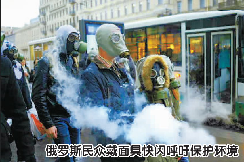
俄罗斯民众戴面具快闪呼吁保护环境

舆论认为,虽然本次峰会上,乌克兰总统亚努科维奇将成为“众矢之的”,但这场博弈的实际对阵者是欧盟与俄罗斯,双方正在这一地区玩着“零和游戏”,而究竟谁能暂占上风,本次峰会就将见分晓。如果乌克兰真的拒绝与欧盟签署协议,欧盟进一步东扩将遭遇重大挫折。甚至有专家认为,本次峰会意义不亚于二战结束时的雅尔塔会议,将重新划定欧洲大陆的政治版图。因此此次维尔纽斯峰会受到各方高度关注。