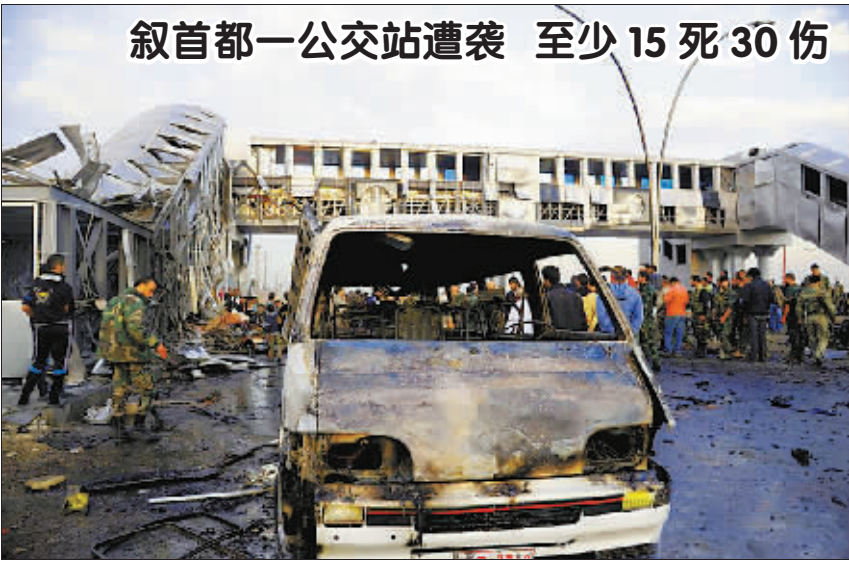
当地时间 11 月 26 日,在叙利亚首都大马士革郊区,一个公交站遭自杀性爆炸袭击,导致至少 15 人死亡,30 人受伤。据媒体报道,政府官员认为此次袭击为恐怖袭击。

此外,本次示威集会目前来看对泰国经济暂时没有太大影响,因为持续时间相对较短,还没有造成大规模政府和私企部门停工和大范围恐慌情绪,但是泰国政局近年来反复不断地动荡对于外国投资者的信心会有一定打击。亚洲开发银行就准备下调今年泰国经济增长率的预期值,同时也希望国内政局动荡不会继续蔓延,以影响消费者信心。