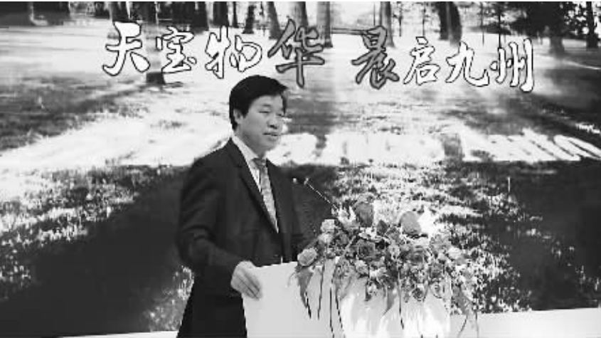
华晨董事长、总裁祁玉民在广州车展