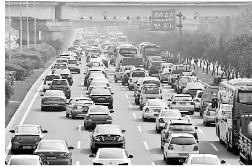
2013年10月7日下午15点,成都三环路成南立交桥附近车流涌动。

“单双号限行”的规定引起市民热议,反对者众。而据成都市环保局在对截止时间收到的意见反馈的分析,约85%的人对“预案”中提出的“单双号限