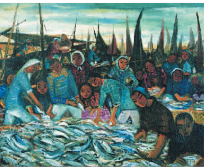
渔妇（油画·20世纪50年代）