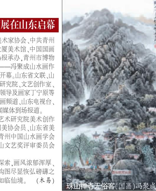
珠山禅寺无俗客（国画）冯聚成