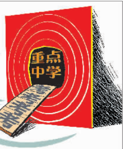
取消考试现纠结 李法明 画