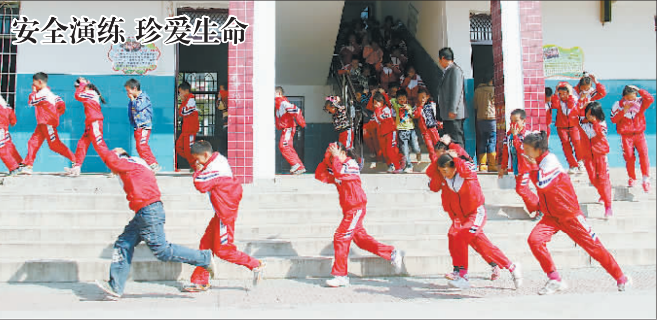
11月6日,随着“呜呜——”的警报声,湖北安陆市王义贞镇中心小学的700多名学生在老师的带领下,迅速有序撤离疏散到宽阔的操场上。秋冬季节,天气变冷,气候干燥,极易发生火灾等各类事故,为了培养学生应对多种灾害的能力,该校在注重对学生进行安全教育的同时,还经常开展安全演练,以提高应对突发事件的能力。

飞飞今年在越秀区铁一小就读六年级,从五年级开始上补习班,周五和周六晚上补习英语和数学,而他们班上一半的同学都跟他一样,从四五年级就开始上补习班,为小升初考试做足准备。当听说明年考试有可能取消时,飞飞妈和很多家长一样,一下子感到“彷徨”:“取消的意图是好的,但我们更关