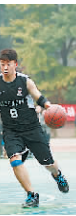
10月28日,由北京市东城区教育工会主办的“释放健康活力·追求青春梦想”东城区教职工“三对三”男子篮球比赛圆满落幕。比赛展示了教职工朝气蓬勃的良好精神风貌,增强了教职工凝聚力。

针对民办教育的法律保护目前还属于空白,未有具体法律条文直接限定民办教育权责。因此,基层法院法官建议,立法机构可以出台具体的民办教育促进法律,行政机关配套管理办法,加大对民办教育机构的政策支持力度,在信贷、税收优惠、财政补贴以及招生保障等方面政策向其倾斜,解除有条件发展民办学校的后顾之忧。同时,工商部门可对民办教育机构实行分类登记、分类管理,从事学前教育和学历教育的民办学校(含幼儿园)参照事业单位法人管理,经营性民办培训机构登记为企业法人,其他类型的民办学校登记为民办非企业单位法人,理顺法人的审查、登记和监督职能。