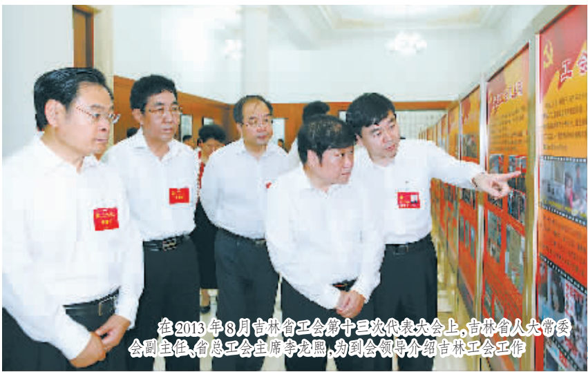
在2013年8月吉林省工会第十三次代表大会上,吉林省人大常委会副主任、省总工会主席李龙熙,向与会领导介绍吉林工会工作