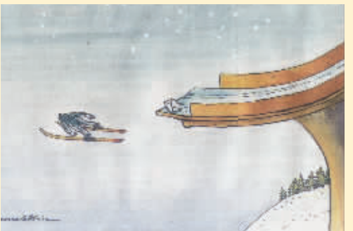
前途暗淡 古泽拉格母(土耳其)

绿茵场上,双方运动员极力避免红黄牌的出现。“4号”却一脚踹在裁判员身上,由此追悔莫及。