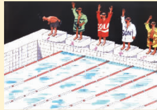
意外遭遇 奥卡科夫斯基(以色列)