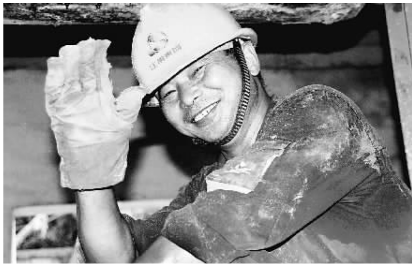
江铜一线职工风采

工会是职工合法权益的代表者和维护者。维护职工权益，帮扶困难职工，关心职工生活，促进企业和职工共同发展，构建和谐的劳动关系，是工会义不容辞的责任。当前，全省各级工会应在全社会唱响“中国梦·劳动美”的主旋律，奏响劳动光荣的时代强音，营造崇尚劳动、尊重劳动的浓厚社会氛围。进一步推进“中国梦·劳动美”主题宣传活动深入开展，进一步做好组织职工、引导职工、服务职工、维护职工合法权益等各方面的工作，营造良好的劳动环境和社会氛围，激发广大职工的劳动热情和创造活力，引领广大职工做辛勤劳动、诚实劳动、创造性劳动的表率，让更多的劳动者生活得有体面、有尊严。动员广大职工把个人梦、家庭梦融入民族梦、国家梦之中，为实现“江西梦”、中国梦而努力奋斗。