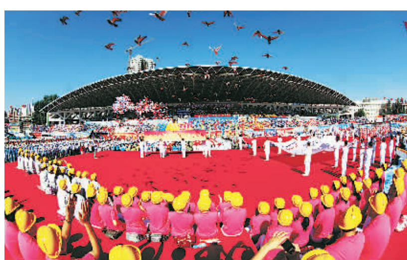
哈尔滨市工人运动会开幕式

《意见》重点解决了困难职工生产生活遇到的实际问题，同时强调在收入分配、劳动、社会保障、精神文化等方面加大帮扶。