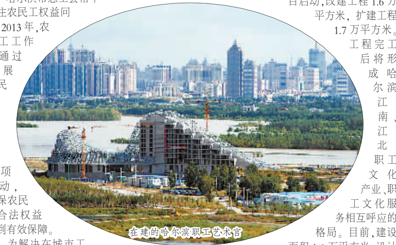
在建的哈尔滨职工艺术馆

工程完工后将形成哈尔滨江南、江北职工文化、产业、职工文化服务相互呼应的格局。目前，建设面积1.6万平方米，设计包含七大功能服务区，600张床位的哈尔滨职工养老院开始筹建，建成后为离退休的劳模、优秀工会工作者和职工群众提供养老服务，真情关爱职工，真心帮助职工，真心服务职工，使工会真正成为职工之家。