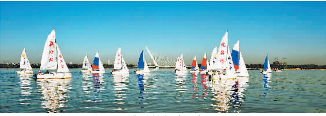
松花江上台帆扬起成为一景