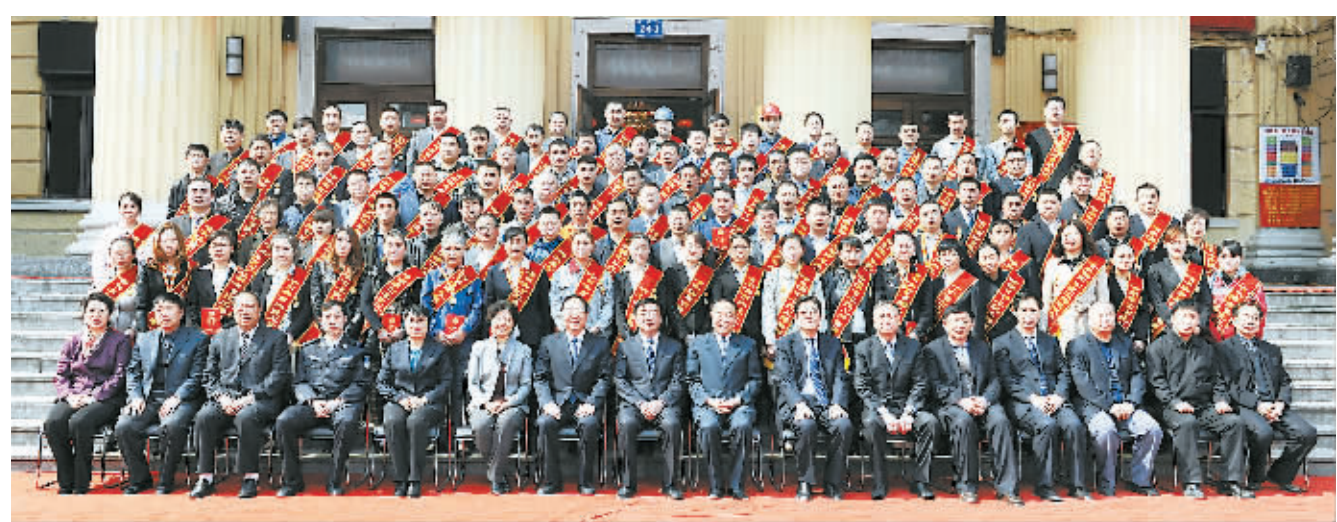
第四届农民工劳模大会

2012年是“十二五”规划的开局之年。哈尔滨市总工会协调下发了《哈尔滨市总工会关于“十二五”期间动员组织职工广泛深入开展劳动竞赛活动的意见》，明确了“十二五”期间开展职工劳动竞赛活动及活动要达到的量化目标。在“当好主力军、建功‘十二五’、和谐促发展”建功立业竞赛活动中，全年共收到职工合理化建议4.3万余条，取得技术革新成果3500余项，累计创经济效益5.1亿元。