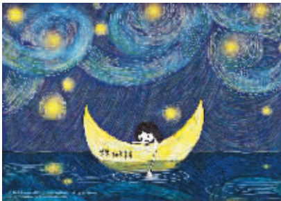
七项创意（台湾设计主题）

9月22日，中国青年艺术家“趋势”水墨展在兰水坊艺术中心举办，参展艺术家均是中国国家画院在职艺术家。展览旨在对水墨艺术发展趋势进行广泛交流和探讨。兰水坊艺术中心为艺术家提供开放的交流平台，定期为青年艺术家举办展览，邀请艺术投资人交流，邀请名家做客讲论，艺术中心开展对外艺术交流项目，并与“窝夫小子”成立研发中心，建立时尚品牌延展、互动平台。（丽娜）