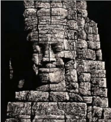
英吴哥·巴戎之颜（木刻）史一