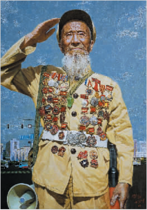
老兵新传（油画）广廷渤