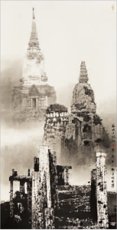
泰国大城府（纸本水墨）刘建