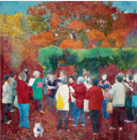
老园丁之歌（油画）杨成国