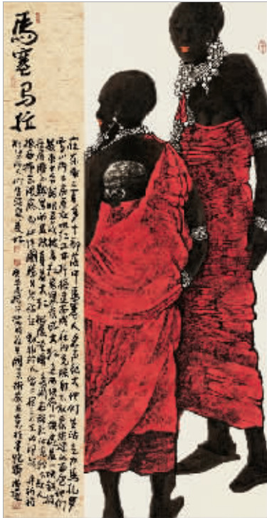
马塞马拉（纸本设色）周尊圣