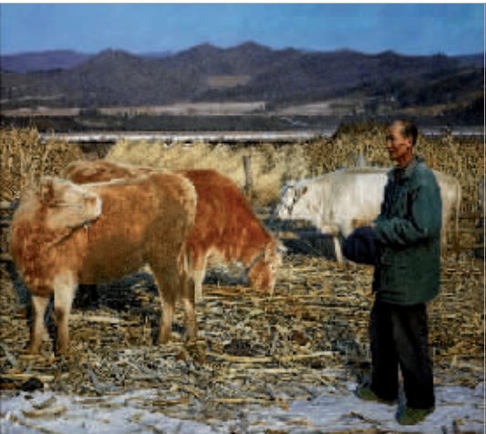
还是一个好年景（油画）