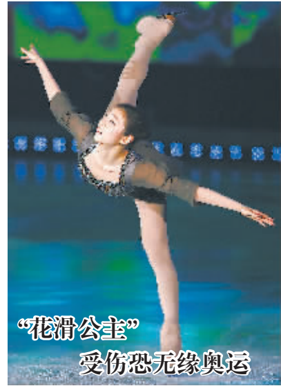
北京时间9月26日,国际滑联官网宣布韩国花滑名将金妍儿因伤将退出本赛季的大奖赛。据韩国媒体报道,金妍儿右脚踝骨受伤,需要6周时间治疗。此次受伤退赛也为金妍儿的冬奥会卫冕之路蒙上了一层阴影。