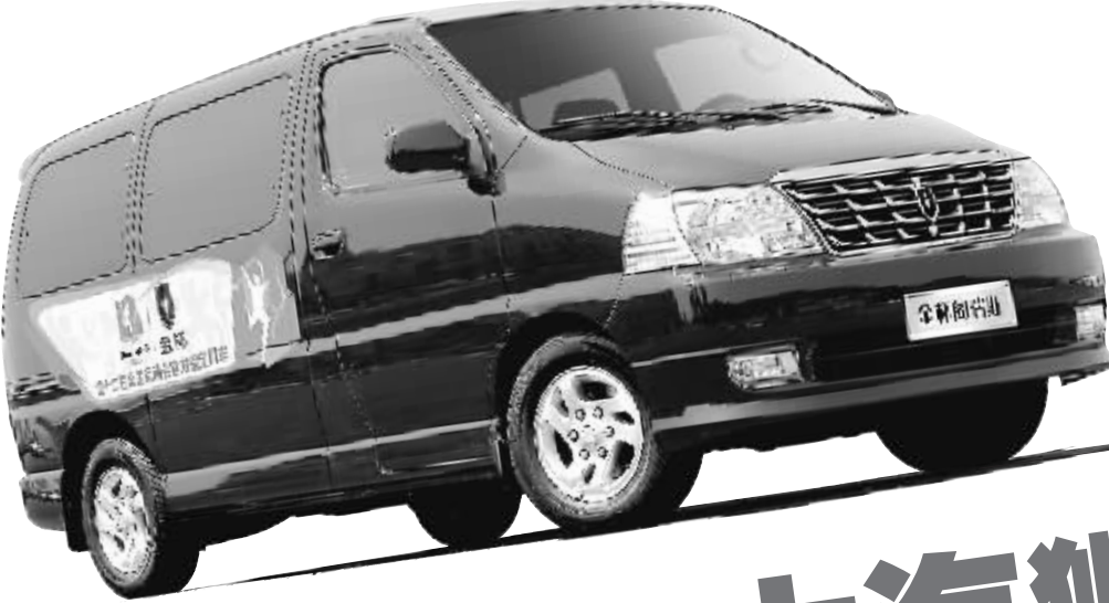
金杯阁瑞斯全运纪念版

据了解,在成都车展上华晨汽车除了推出两款金杯全运纪念版车型之外,金杯品牌还有两款参展车型:大海狮L领航版、海狮快运王;另外,中华品牌旗下展出8款车型:A+级车中华V5 1.5AT、中华V5 1.6MT、中华H530;A级车中华H330和中华H320,A0级车中华H230和中华H220,以及深受欢迎的中华骏捷FSV等热门明星产品,一展华晨汽车雄厚的研发实力。