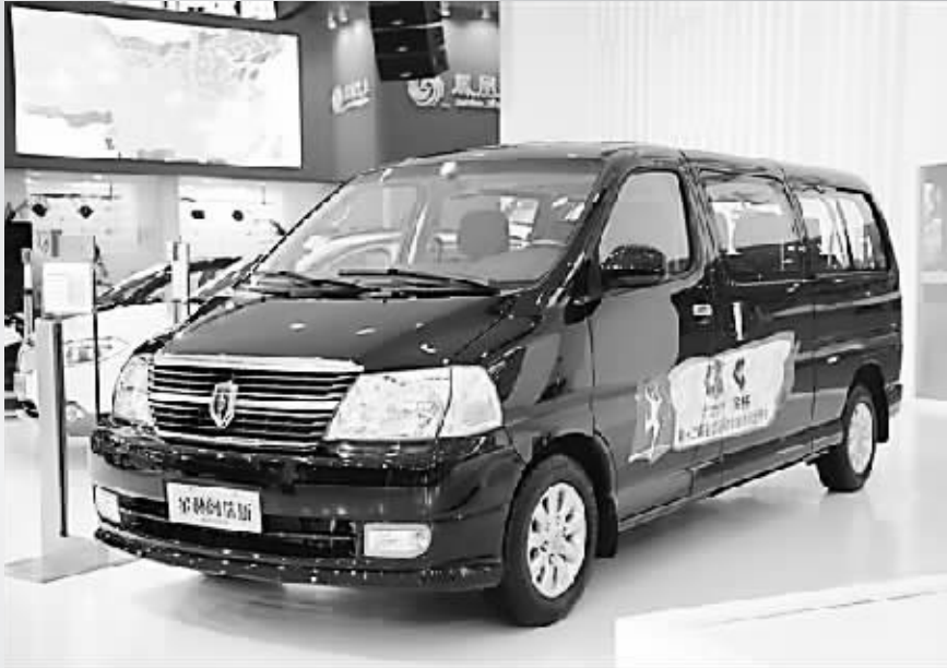
金杯阁瑞斯全运纪念版成都车展上市

金杯品牌通过自身的不断努力积极探索,造就了中国轻客市场的一个个传奇:首个以技术引进形式成长起来的商用车自主品牌;首个实现轻客超百万辆的轻客领军企业;第一个连续16年蝉联中国轻客市场销售冠军的企业。毫不夸张地说,金杯品牌的发展历程就是中国轻客市场不断走向成熟的缩影,是中国轻客历史上永不磨灭的“番号”,而金杯旗下产品线的日益丰富则折射出中国商用车事业的腾飞与进步。