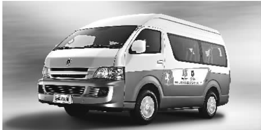
金杯大海狮全运纪念版