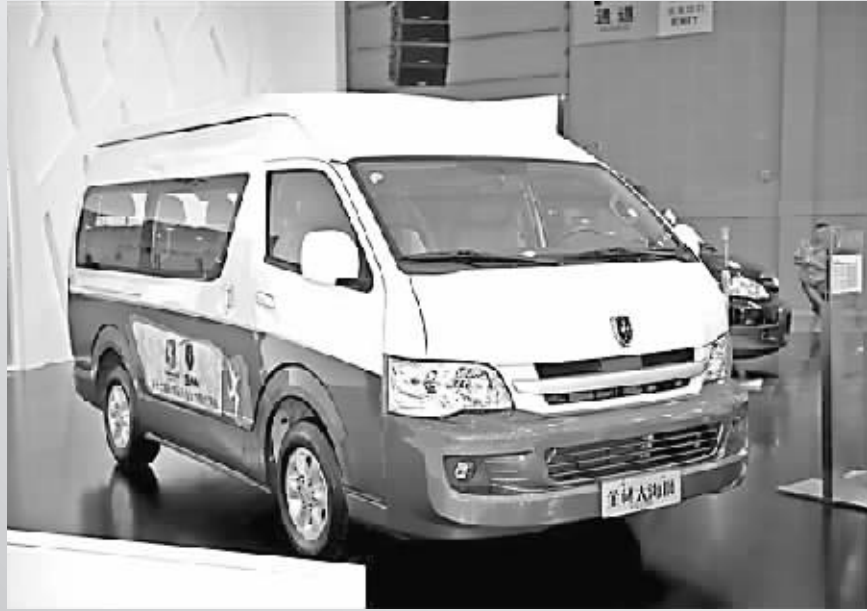
金杯大海狮全运纪念版成都车展上市