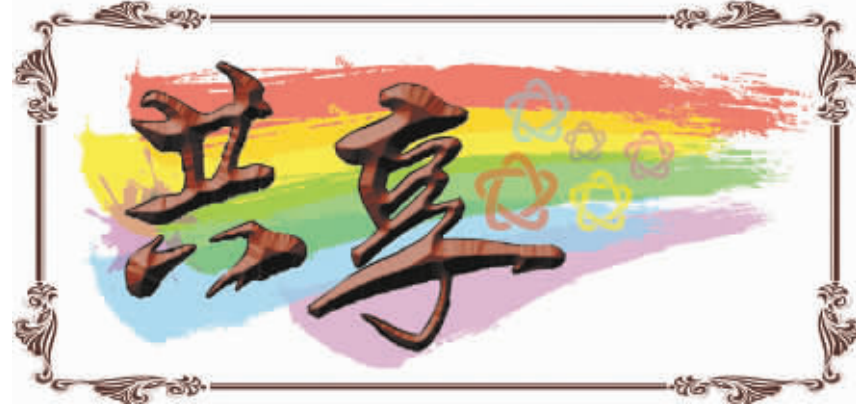
第12届全国运动会特刊 ⑨