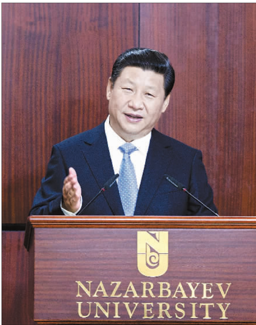
新华社阿斯塔纳9月7日电(记者魏建华 周良)国家主席习近平7日在哈萨克斯坦纳扎尔巴耶夫大学发表题为《弘扬人民友谊 共创美好未来》的重要演讲,盛赞中哈传统友好,全面阐述中国对中亚国家睦邻友好合作政策,倡议用创新的合作模式,共同建设“丝绸之路经济带”,将其作为一项造福沿途各国人民的大事业。 当地时间上午10时30分许,习近平在哈萨克斯坦总统纳扎尔巴耶夫陪同下步入会场。 在热烈的掌声中,习近平发表了重要演讲。 习近平表示,2100多年前,中国汉代的张骞两次出使中亚,开启了中国同中亚各国友好交往的大门,开辟出一条横贯东西、连接欧亚的丝绸之路。哈萨克斯坦是古丝绸之路经过的地方,曾经为促进不同民族、不同文化相互交流和作出过重要贡献。千百年来,在这条古老的丝绸之路之上,各国人民共同谱写出千古传诵的友好篇章。 习近平指出,两千多年的交往历史证明,只要坚持团结互信、平等互利、包容互鉴、合作共赢,不同种族、不同信仰、不同文化背景的国家完全可以共享和平,共同发展。 习近平强调,20多年来,随着中国同欧亚国家关系快速发展,古老的丝绸之路日益焕发出新的生机活力。发展同中亚各国的友好合作关系是中国外交优先方向。我们希望同中亚国家一道,不断增进互信、巩固友好、加强合作,促进共同发展繁荣,为各国人民谋福祉。 习近平提出以下主张:要坚持世代友好,做和谐睦邻的好邻居。中国尊重各国人民自主选择的发展道路和奉行的内外政策,决不干涉中亚国家内政,不谋求地区事务主导权,不经营势力范围。要坚定相互支持,做真诚互信的好朋友。在涉及国家主权、领土完整、安全稳定等重大核心利益问题上坚定相互支持,合力打击“三股势力”、贩毒、跨国组织犯罪。要大力加强务实合作,做互利共赢的好伙伴。我们要将政治关系优势、地缘毗邻优势、经济互补优势转化为务实合作优势、持续增长优势,打造利益共同体。(下转第3版)

9月7日,国家主席习近平在哈萨克斯坦纳扎尔巴耶夫大学发表题为《弘扬人民友谊 共创美好未来》的重要演讲。