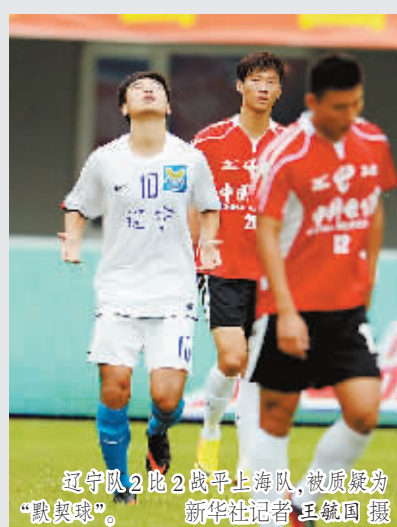
辽宁队2比2战平上海队,被质疑为“默契球”。

全运会的足球比赛改革始于在山东举行的上届全运会——以往只设男足甲组(U20)和女足成年组的基础上,增设了男女足乙组即青少年组。具体到本届全运会,足球比赛共有4个组别,分别是男足U20和U18组,以及女足成年组和U18组。与上届全运会男女足冠军分别算两枚