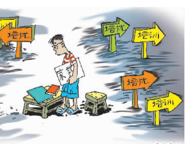
上不完的培优班 李法明画

专家建议,学习知识应当以学校教育为主,即使“培优”,也应该从孩子的兴趣出发,不应盲目跟风,更不应盲从培训机构的所谓专业效应。