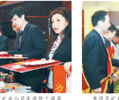
集团及矿业公司领导为受表彰的机关先进工作者颁奖