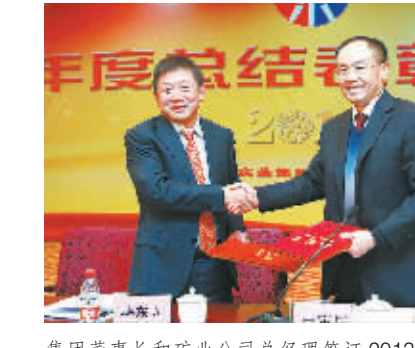
集团董事长和矿业公司总经理签订2013年度责任状