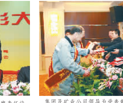
集团及矿业公司领导为受表彰的矿业公司先进职工颁奖