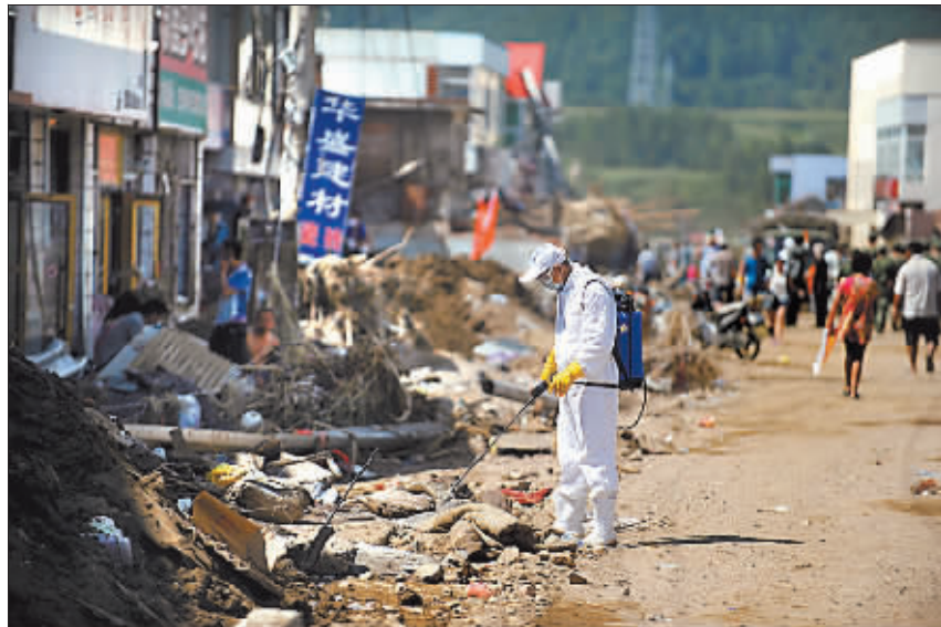
8月20日,防疫人员在抚顺市清原满族自治县南口镇进行消毒。当日,辽宁抚顺洪水灾区病毒消杀工作有序进行,专业医护人员在受灾地区喷洒消毒液、检查村民健康情况,严防防疫传播。