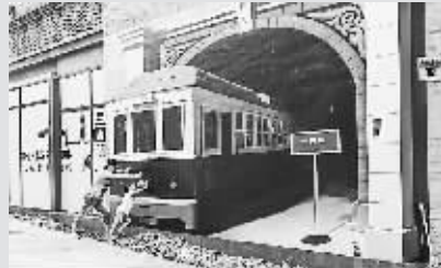
两位游客在3D立体画“铛铛车来了”前做推动状。