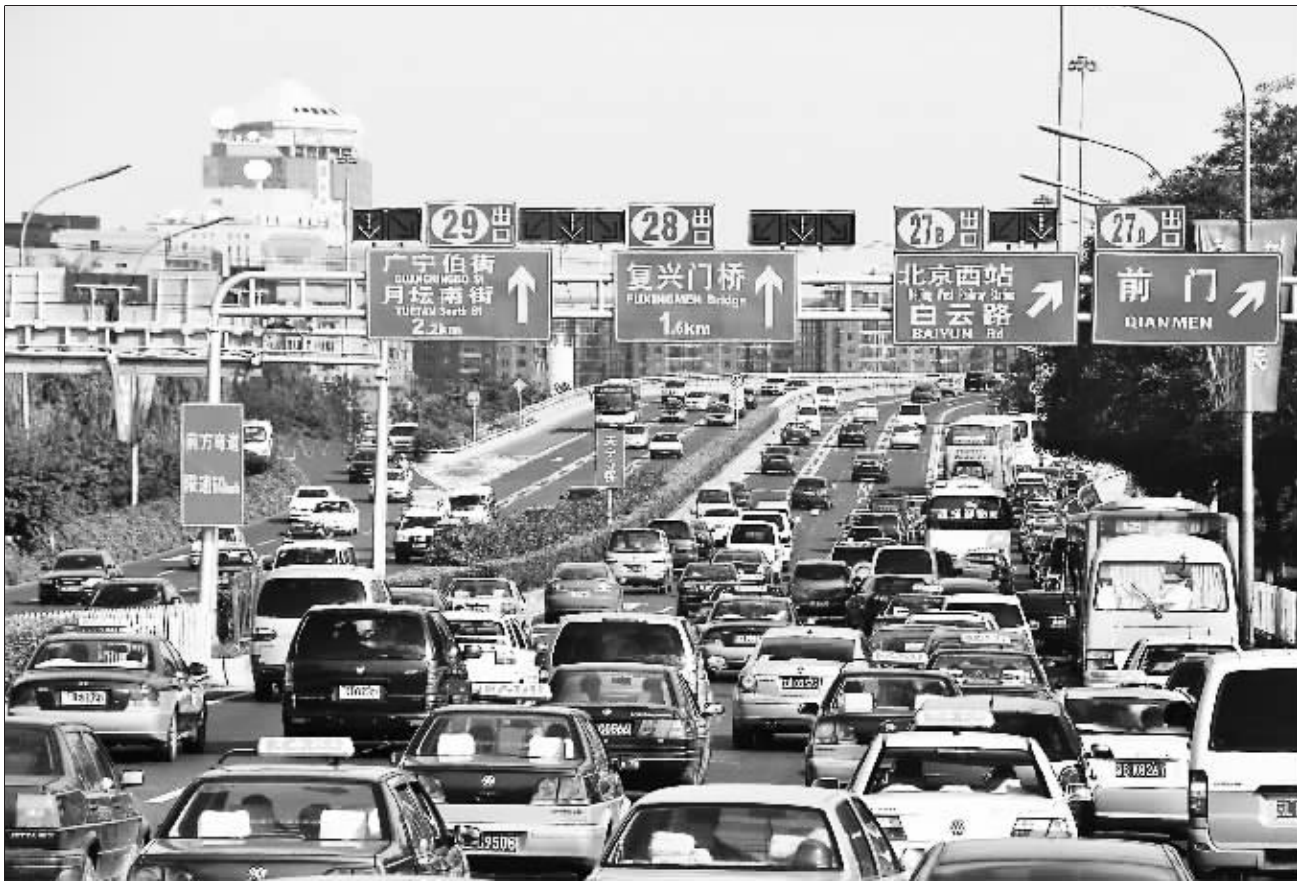
北京市街头的众多出租车。 素描/东方IC

在安德里北街,出租车扬招站标志牌黄蓝相间,与出租车颜色相仿。记者在现场观察了约十分钟,并没有看到有人在此等车。附近的一位保安说,“路口出租车比较多,打车也比较方便,很少有人在这打车。”