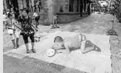
游客被3D立体画“斗蟋蟀”所吸引。