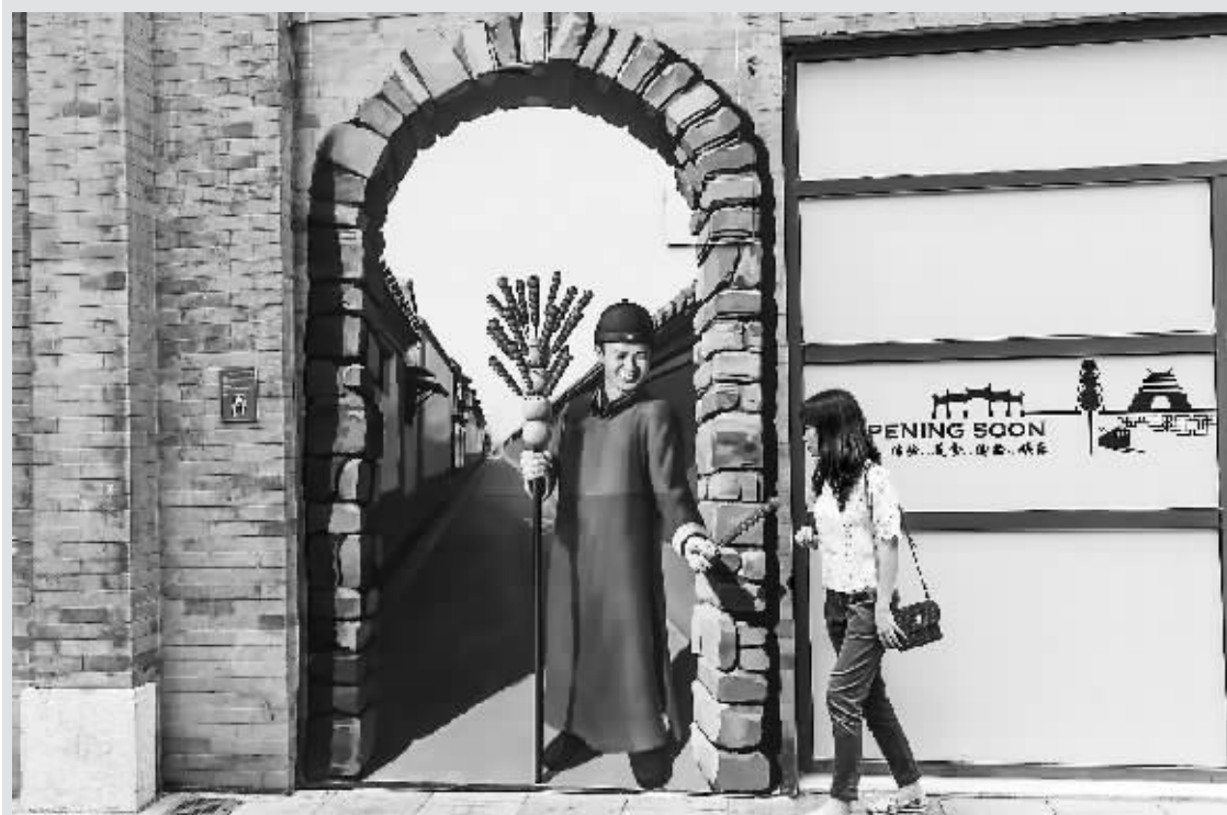
游客在3D立体画“未串糖葫芦”前拍照留影。

通过此次检查,大队及时发现并消除了一批火灾隐患,进一步增强了被检单位管理人员的消防安全意识,提高了辖区整体的火灾抵御能力,优化了消防安全环境。(温明霞 陈阳)