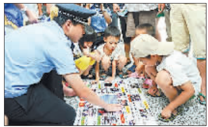
8 月 8 日,杭州铁路公安处开展“浙江铁路暑期平安伴您平安出行”主题宣传活动。民警在杭州东站候车室内展示“乘车安全小账本”,提醒旅客注意乘车安全。

据悉,此项工程历时三年,今年举办培训班 7 期,历时 5 个月,每期培训 110 人。青海省委讲师团、省委党校、省青少年心理健康中心、省民族宗教委员会以及省外青少年研究领域知名专家等 10 多家单位的 20 余名著名专家和教授,采取课堂授课、专题研讨、案例分析、教学互动、经验分享等方式对全省各地的中小学班主任、少先队辅导员和担任思想品德、思想政治课的 1 万名教师进行未成年人思想道德建设专题培训。