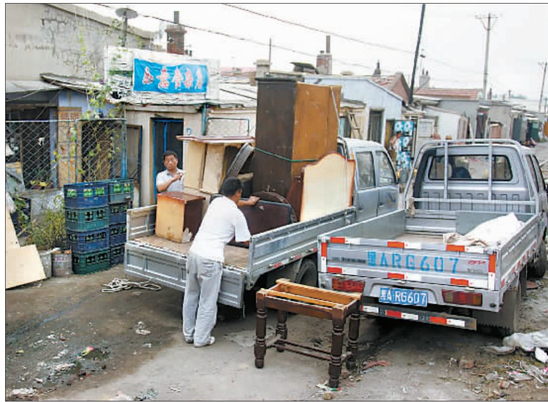
哈尔滨千户居民搬离易涝棚户区

8月12日,哈尔滨市道外区北岗社区的棚户区居民正在收拾家具装车,忙着搬家。老张说,当地是一处洼地,排水不畅,每次下大雨都要被淹,最严重的一次积水都到腰部了;棚户区内环境非常差,垃圾乱倒,污水横流,胡同狭窄,着火时连消防车都开不进来;走访时看到,这里家家户户都在忙着收拾东西,准备搬迁;而棚户区内的一条主道上,积水至今也没有完全退去。