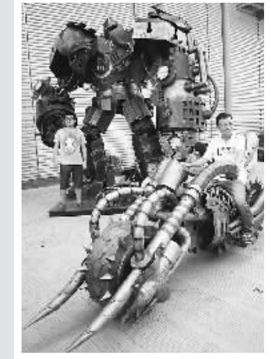
一男子通过实物场景体验游戏。

戏体验试玩、周边礼包纪念品大派送、华丽COSPLAY(角色扮演)各种穿越都是必不可少的大餐。今年除了网络游戏强势外,手机平板等APP网络游戏也开始逆袭,新媒体游戏平台发展速度迅猛。本届展会约有来自全球30多个国家和地区400多家企业参加,参展游戏作品600多款,展出面积约6万多平方米。