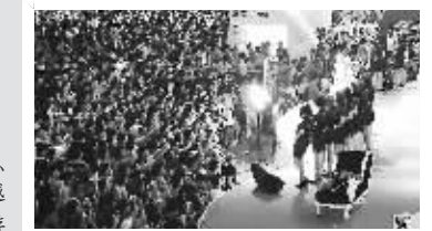
观众挤爆现场,只为睹Showgirl芳容。 云猫/东方IC