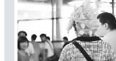
头戴刺帽的男子。