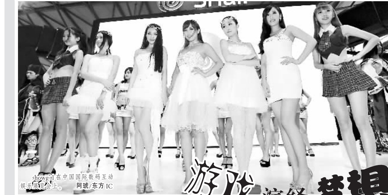
Showgirl在中国国际数码互动娱乐展览会上。

江山市青年电子商务协会目前有会员120多人,主要为青年网上创业者、供应商会员、第三方服务商会员等,为了拓宽青年网商融资渠道,银行将为电子商务协会会员提供资金优先、手续简便的贷款,助推青年网商做大做强做优,实现互惠共赢。(郭伟俊)