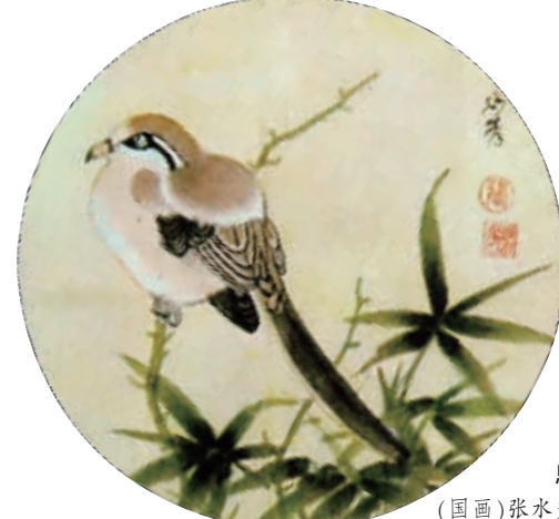
觅食图(国画) 韩春明