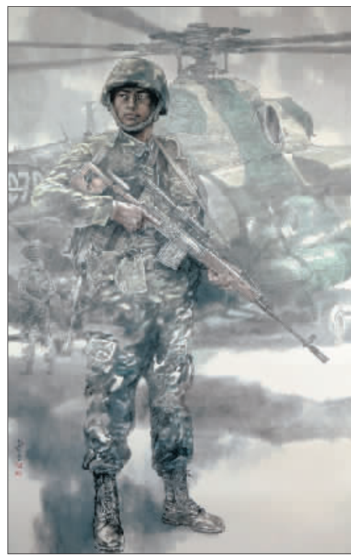
狙击手(国画) 仓小宝