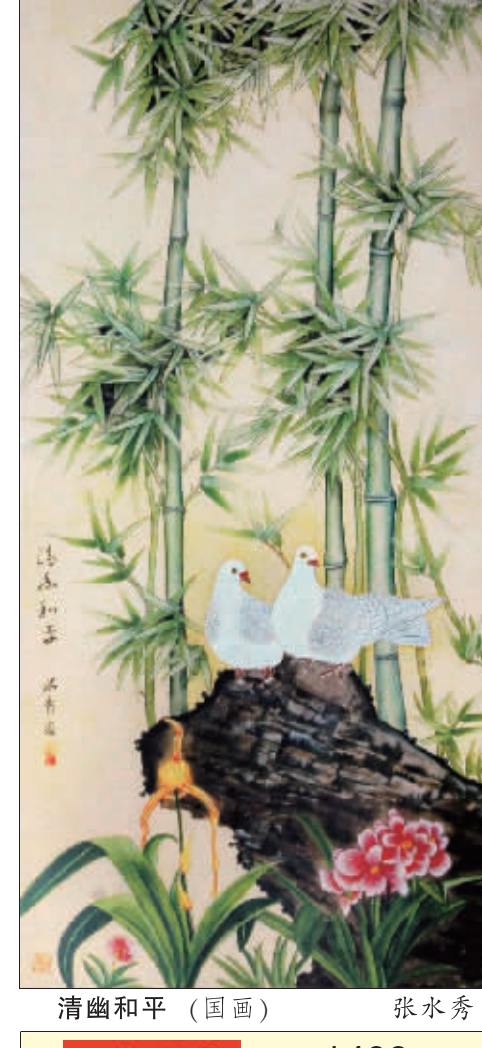
清幽和平(国画) 张水秀