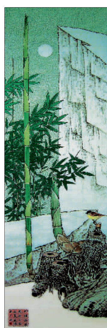
竹报平安(国画) 韩春明