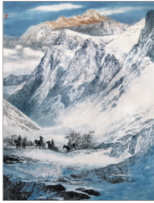
踏雪巡逻戍边关(国画) 仓小宝