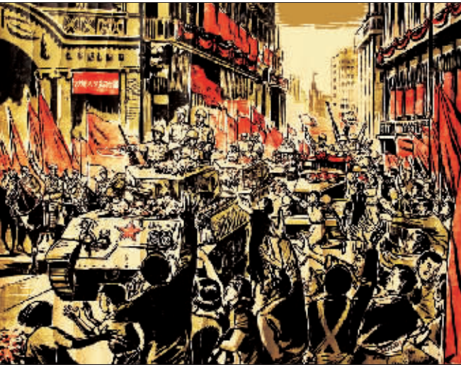
解放上海(版画) 陈烟桥

之 寔之謂美 寔之謂多 寔之謂大 寔之謂化 我 物也 高 物也 心 愛 物也 悠 久 所 以 成 物 也 抑 庸 愛 之 之 寔之謂美 寔之謂多 寔之謂大 寔之謂化 我 物也 高 物也 心 愛 物也 悠 久 所 以 成 物 也 抑 庸 愛 之