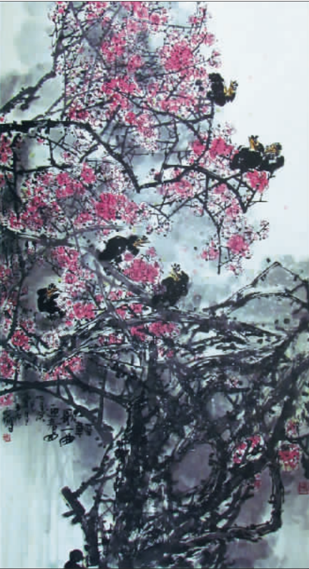
轻歌一曲迎春回(国画) 王玉和