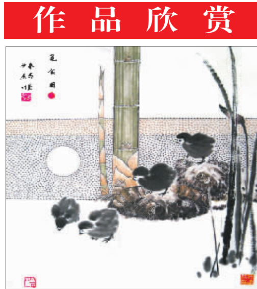
觅食图(国画) 韩春明