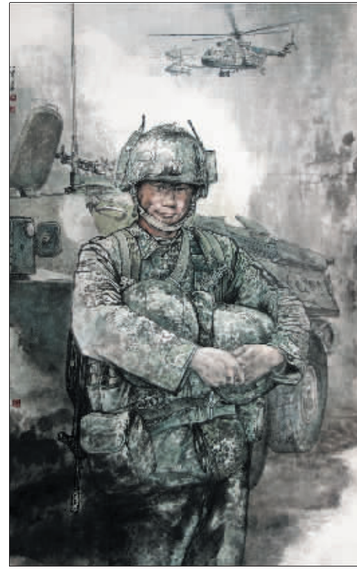
特战班长(国画) 仓小宝