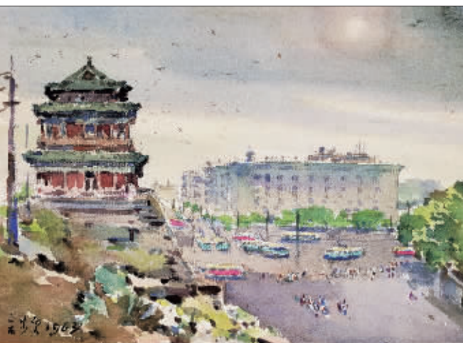
崇文门旧貌(水彩) 宋步云