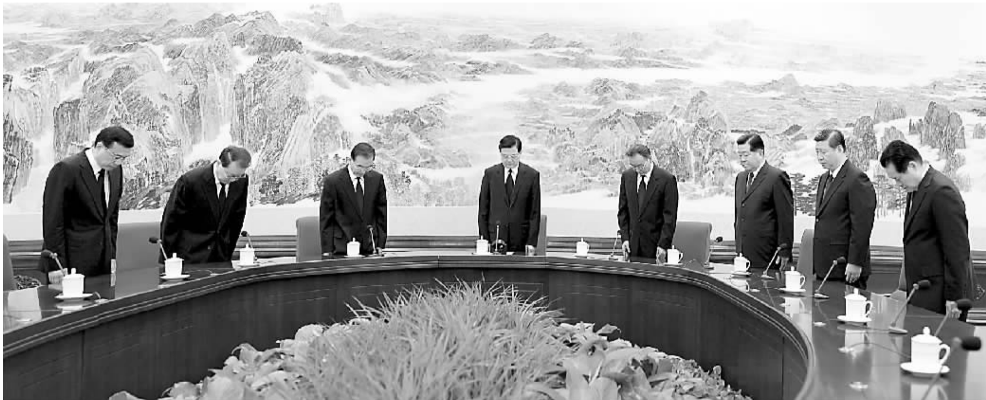
8月15日上午,中共中央政治局常务委员会会议在中南海举行。会议开始时,胡锦涛、吴邦国、温家宝、贾庆林、李长春、习近平、李克强、周永康等全体起立,向甘肃舟曲特大山洪泥石流中遇难的同胞默哀。