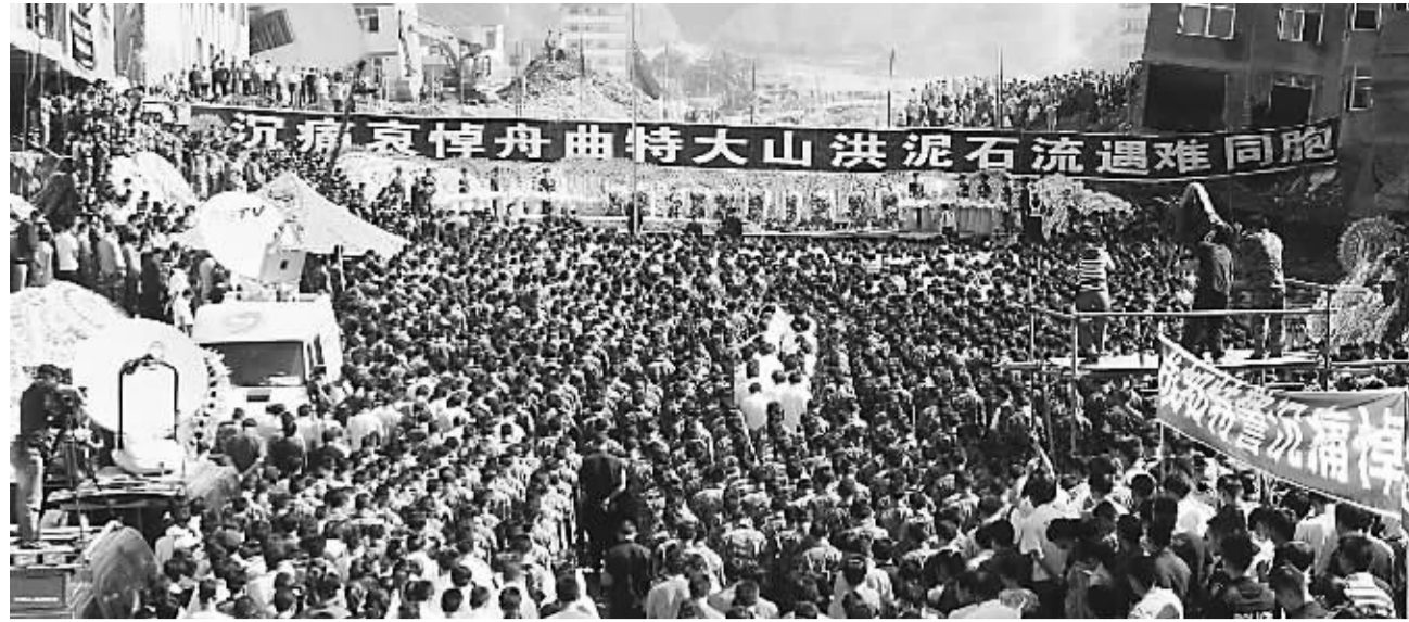
8月15日,人们在甘肃舟曲泥石流受灾现场举行哀悼活动。