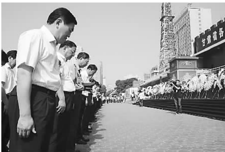
8月15日上午,兰州东方红广场举行万人悼念活动,向舟曲特大山洪泥石流遇难同胞致哀。