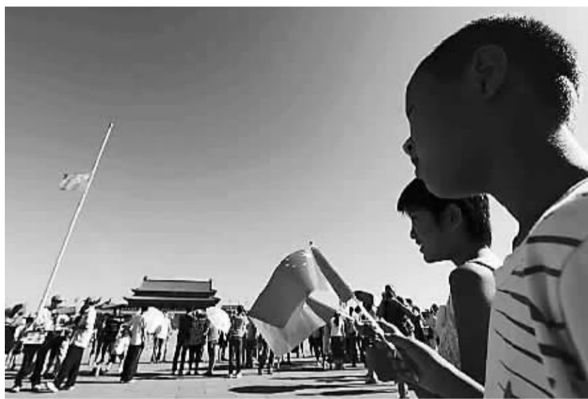
8月15日上午,两位小朋友在父母的带领下来到北京天安门广场半降的国旗前肃立默哀,哀悼甘肃舟曲特大山洪泥石流遇难同胞。