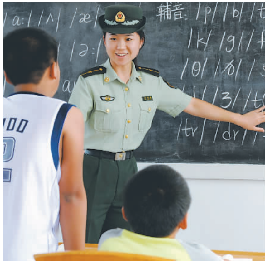
日前，河北省秦皇岛市西河南边派出所针对辖区群众外出打工多、留守儿童暑假无人管的实际，开展了“牵手留守儿童，共享快乐暑假”夏令营活动。为了搞好活动，他们在所里腾出一间屋子作教室，让大学生民警给孩子们辅导功课，安排娱乐活动，让辖区留守儿童度过一个快乐、安全、有意义的暑假。

李强建议，应该成立一个包括管理和技术监督两个层面的机构，定时发布互联网监控数据，如合法网站的白名单，以及非法网站的黑名单，实施互联网接入白名单制度；同时实现预先监测，自动封堵，提前打击。